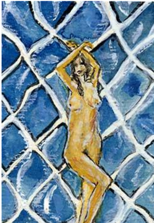
Corpore Chiastico Tournante dv 14/07/2006, waterverf & pen, 62x87mm, 428,00 €

Congres, sta! Doek, open! Ziehier het Corpore Chiastico Tournante :