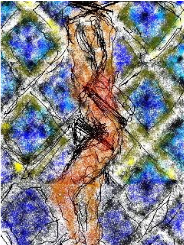
Sony Clié drawings 16/07/2006